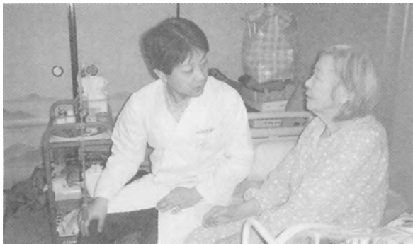
寝たきり老人在宅総合診療の場面

を含んだ概念で、神経衰弱、心臓神経症、不眠症、自律神経失調症、甲状腺機能亢進、高血圧症、脳梗塞、不整脈、冠動脈疾患(狭心症、心筋梗塞)、心臓弁膜症・・・などに関係があります。