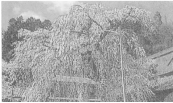
北小松・徳勝寺のしだれ桜

「○○さん、診察を始めてよ。」 Aさんの羞恥心をできるだけ減らすように、徐に腔鏡を挿入し、外陰部、膣口、膣壁、子宮腔部などを診察し、異常部位を探していきます。見たところ、特に異常なく、お産を経験されているので、子宮腔部に軽度の糜爛が見られました。そこで、「これから、子宮頸癌の検査をしますが、痛くありませんから、安心して下さい。」と言って、手際よく子宮腔部と子宮頸部を擦過し、細胞診検査を実施しました。特に、膣炎や子宮頸管炎を起している様子でもなく、分泌物検査はしませんでした。子