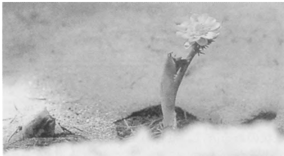
春を待ちわびる花ーフクジュソウ

52歳女性、「高血圧症」「頭痛」 で来院。赤ら顔。肥満型。右胸脇 苦満(季肋部の抵抗圧痛、圧迫感)、 心下痞硬(みぞおちの抵抗)、臍 上悸(臍の上方の動悸)、左腸骨