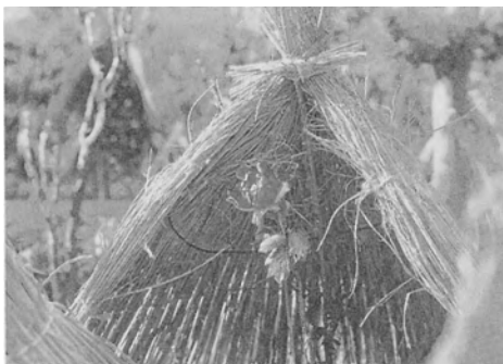
大輪を咲かせる寒ボタンは大きな帽子の中に

後や流産後にかかわらず、同じ漢方薬を用います。その代表的漢方薬が、桂枝茯苓丸（桂枝、茯苓、牡丹皮、桃仁、芍薬）です。ただ、どの漢方薬を用いるかは、病氣