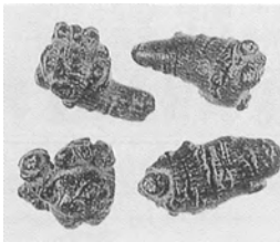
■ 田七人參 止血作用、抗酸化作用、抗腫瘍作用がある。

田七人參は、中国雲南省文山県を中心に、標高千メートルの高地で栽培され、播種から3〜7年してやっと収穫できます。子宮出血、血尿、血便、鼻血、吐血、