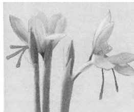
■ サフランの花 ひとつの花にめしべは1本、その先は、3つに分かれている

打撲、狭心症、高脂血症、高コレステロール血症に使われ、非常に貴重な薬なので、「金不换」とも呼ばれています。当院では、田七末として使用しています。