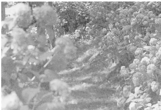
三千院のアジサイ株。初夏の香りを漂わす静寂の空間だ

よくする、頭痛がするようになった、背中や腰がこわばるようになった、車に酔いやすくなった、昼過ぎてやっと頭がはつきりする、夜になると、目が冴えて寝られない、手足の関節に時々痛みが起る。