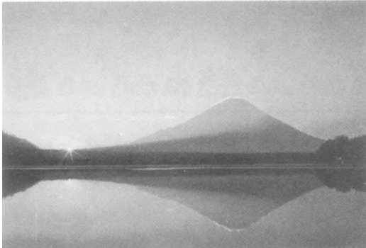
山梨県 精進湖 夜明けの富士(1月)

から、凜とした美しい姿は、全く変わりません。この富士山のように、いつでも変わらない清楚さを身